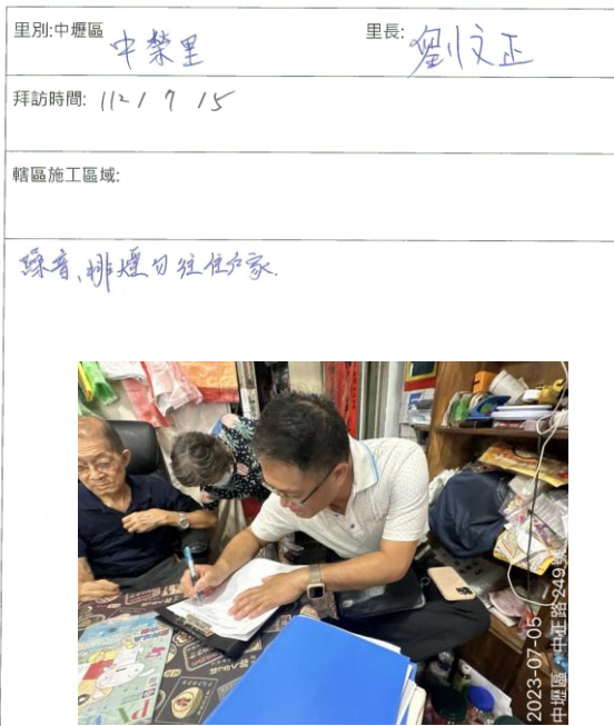
促進民間參與桃園市中壢地區污水下水道系統之興建、營運、移轉(BOT)計畫